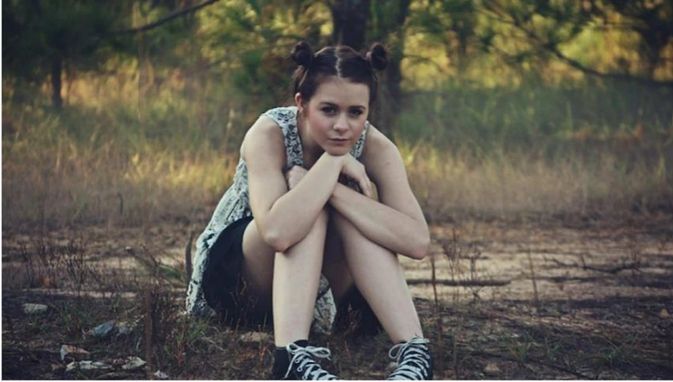
Teenagers who make some decisions about where they go and what is important to them often do better.

"Um dia não viveremos ao lado dos nossos jovens ou teremos muito contributo sobre as suas vidas. De repente, terão total controlo sobre o que fazem, com quem passam tempo e como tomam decisões. Se não proporcionarmos gradualmente e cada vez mais a liberdade enquanto estivemos lá para os treinar e apoiar, então os seus erros podem ter consequências muito maiores no futuro".